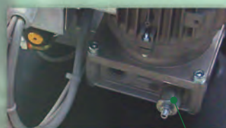
Valvola di regolazione pressione massima di lavoro